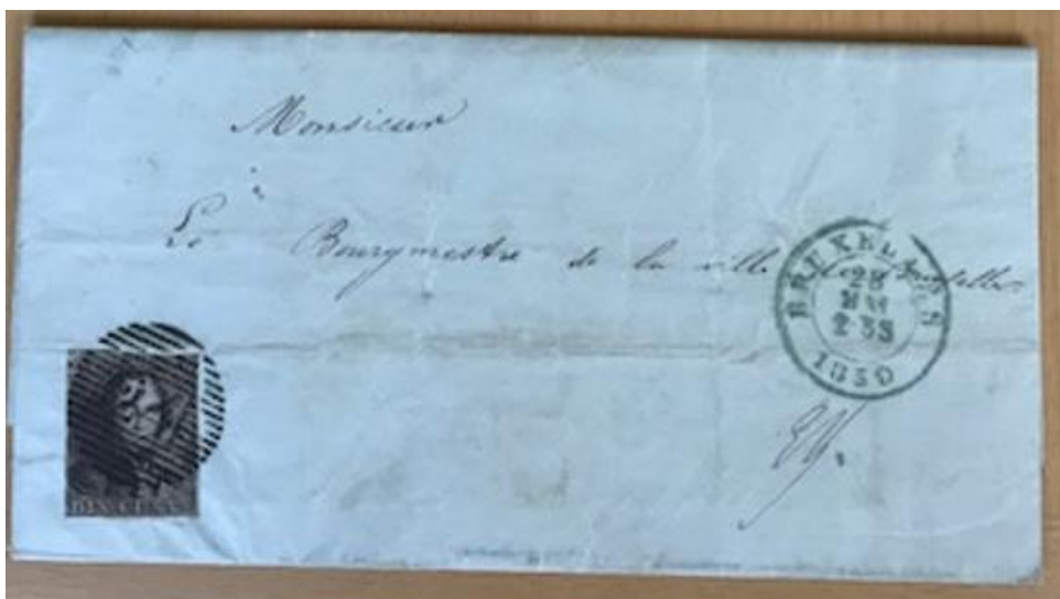
1850, brief gericht aan Charles de Brouckere